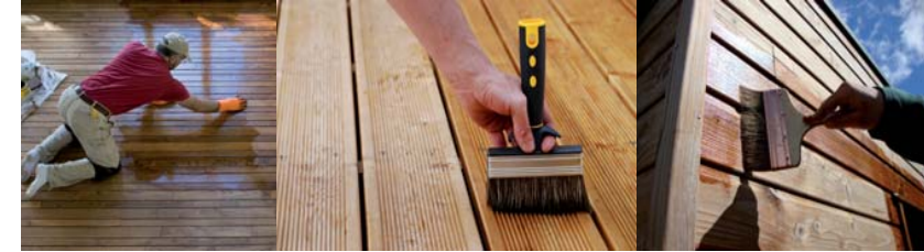
HUILE HAUTE QUALITE ENVIRONNEMENTALE

Tout le savoir-faire OLEOBOIS au service des professionnels